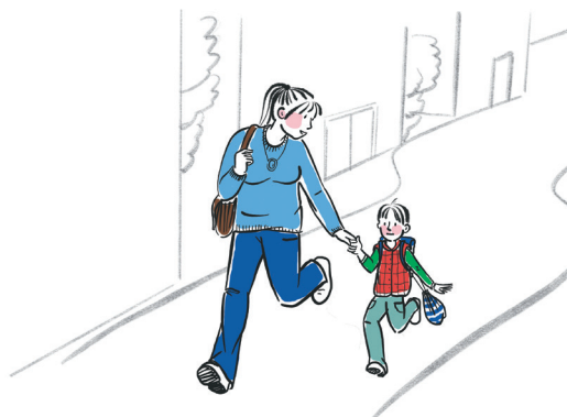
Поход на рынок или в школу/сад за другими детьми