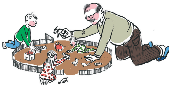
Игры, пение, чтение, пересказ историй