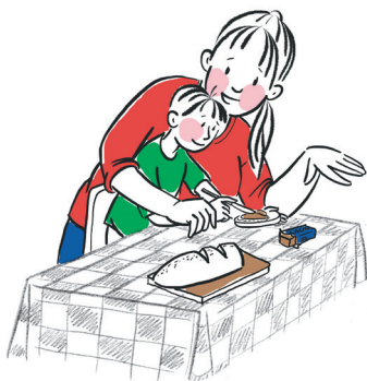
Приём пищи, одевание, гигиена

Повседневные дела — это вовсе не специальные задания, разработанные кем-то для детей.